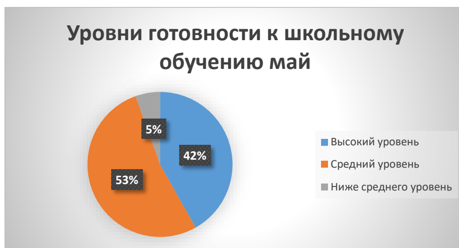
Рис.1 Уровни готовности к школьному обучению